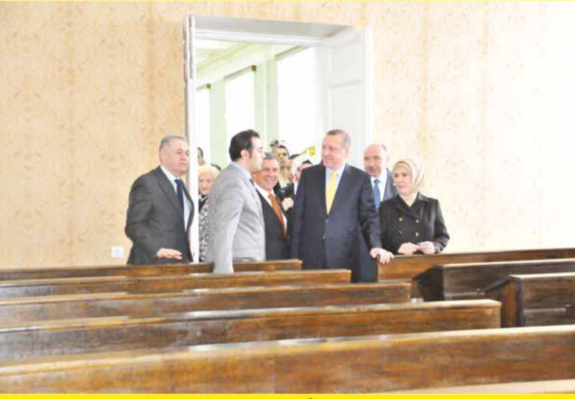
Başbakan Erdoğan, Kazan Üniversitesi'nde Lenin ve Tolstoy'un eğitim gördüğü sınıfı gezdi