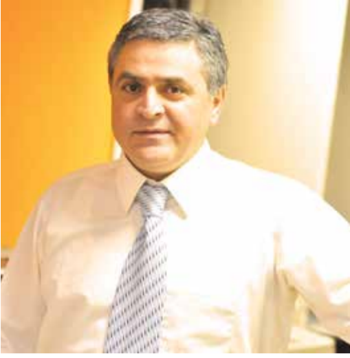
Tverskaya'daki Puşkin Meydanı'nın alt kısmında Balşoy Dimtrovka 23 numarada bulunan Copymos'a 694 17 76 ve Mob: 8 925 545 86 66 numaralarından ulaşılabilir.

Ofisimize gelip biyometrik pasaportlar için resim çektiren hiç kimseden ücret almaya-çalış. İsterse ailesi ile gelsin. Hatta eşi veya çocuğu Rus olan vatandaşlarımızın eşleri ve çocukları için lazım olan fotoğrafları da ücretsiz çekiyoruz. Bu hizmetimizi de 2011 yılının sonuna kadar devam ettireceğiz."