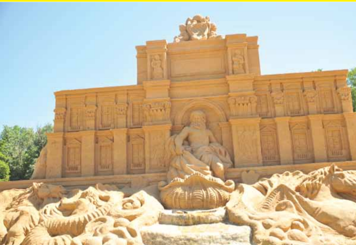
Dünyaca ünlü fısıkiyeler Vedenha Parkı'nda kumda yeniden hayat buldu. Yaz sonuna kadar gezilebilir.