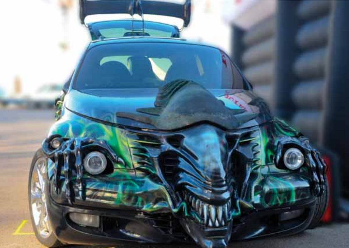
Moskova sokaklarında modifiye bir araç