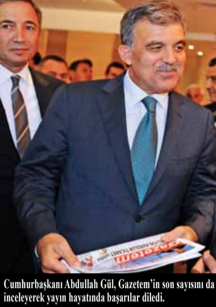
Cumhurbaşkanı Abdullah Gül, Gazetem'in son sayısını da inceleyerek yayın hayatında başarılar diledi.

Gül, bölgede önemli bir aktör olan Rusya ile yoğunlaşan ilişkilerin hem bölgesel hem küresel planda olumlu etkileri olacağını düşündüklerini de belirtti.