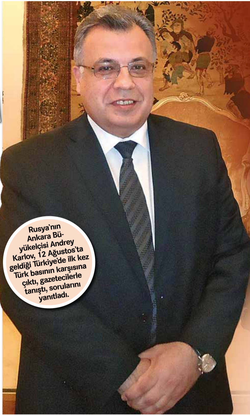
Rusya'nın Ankara Büyükelçisi Andrey Karlov, 12 Ağustos'ta geldiği Türkiye'de ilk kez Türk basının karşısına çıktı, gazetecilerle tanıştı, sorularını yanıtladı.