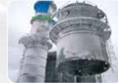
Teknolojik Makina&Ekipman Montajı