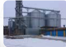
Anahtar Teslim İnşaat İşleri