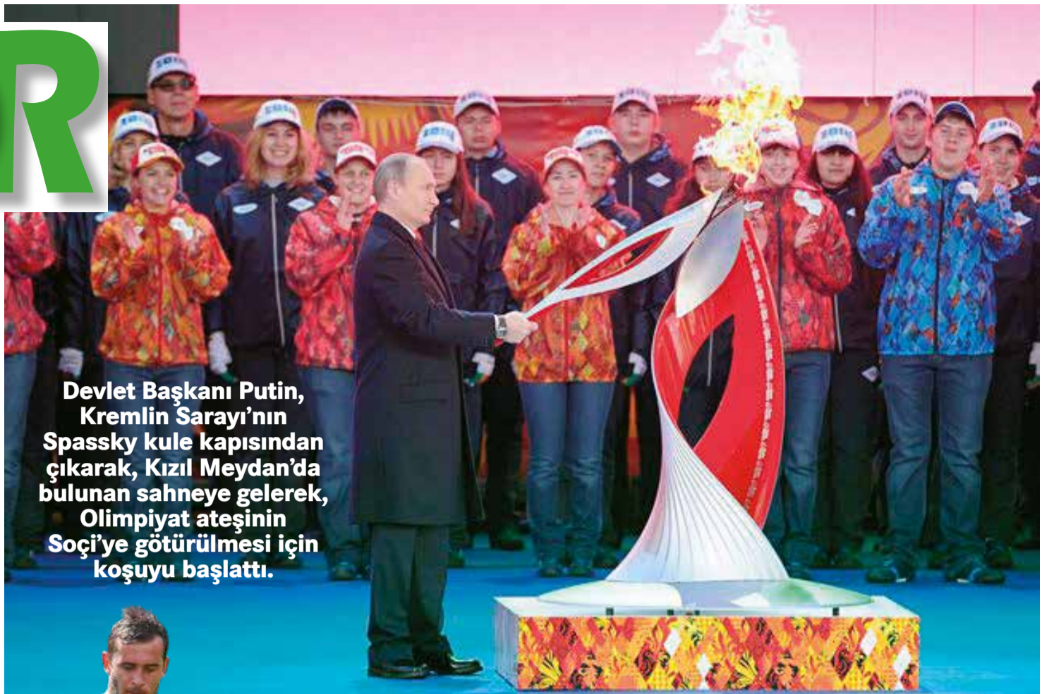
Devlet Başkanı Putin, Kremlin Sarayı'nın Spassky kule kapısından çıkarak, Kızıl Meydan'da bulunan sahneye gelerek, Olimpiyat ateşinin Soçi'ye götürülmesi için koşuyu başlattı.