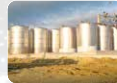
Paslanmaz Tank&Silo İmalat ve Montajı