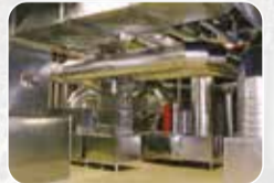
Havalandırma, Yangın ve Duman Sistemleri Üretim ve Satışı

MOSKOVA 1.Graivoronovsky Proezd, 20 Tel:+7 (495) 234 27 77 Fax:+7 (495) 956 24 17