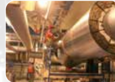
Ekipman ve Boru İzolasyonu