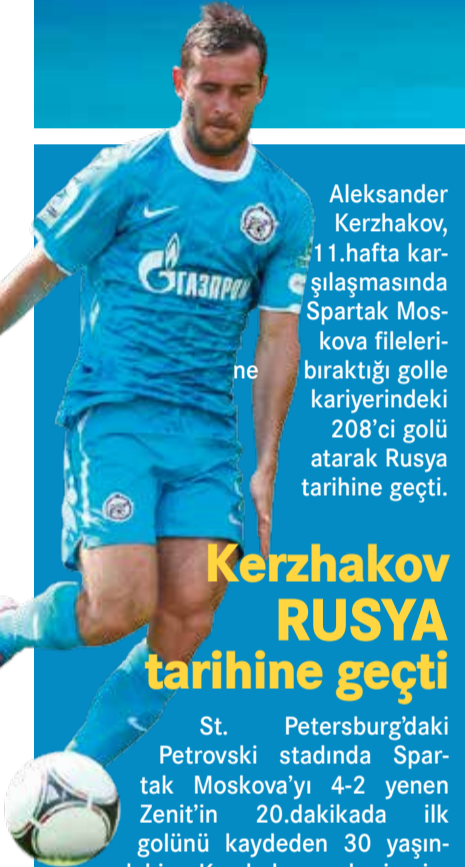
Aleksander Kerzhakov, 11.hafta karşılaşmasında Spartak Moskova fileleri bıraktığı golle kariyerindeki 208'ci golü atarak Rusya tarihine geçti.