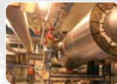
Ekipman ve Boru İzolasyonu