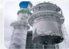
Teknolojik Makina&Ekipman Montajı