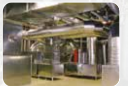
Havalandırma, Yangın ve Duman Sistemleri Üretim ve Satış