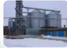
Anahtar Teslim İnşaat İşleri