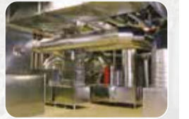
Havalandırma, Yangın ve Duman Sistemleri Üretim ve Satışı