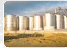
Paslanmaz Tank&Silo İmalat ve Montajı