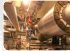
Ekipman ve Boru İzolasyonu