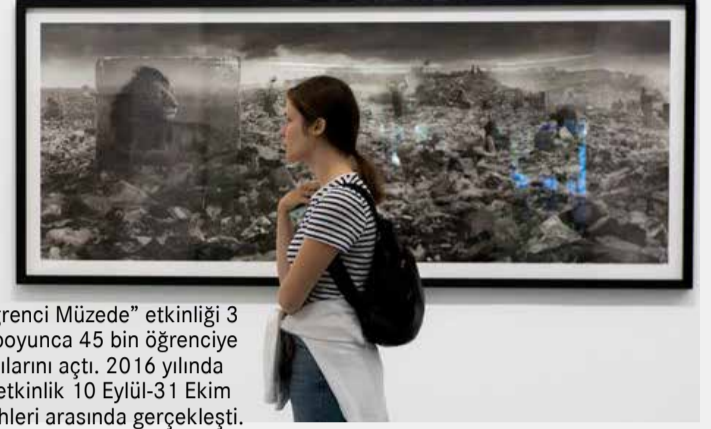
"Öğrenci Müzede" etkinliği 3 yıl boyunca 45 bin öğrenciye kapılarını açtı. 2016 yılında bu etkinlik 10 Eylül-31 Ekim tarihleri arasında gerçekleşti.

bildirdi. Fakat bu sayının artacağı belirtildi. Şu anda bu listede Anatoliy Zverev Müzesi, Moskova Çağdaş Sanatlar Müzesi, Art Müze, Marina Tsvetayeva Müzesi, Endüstriyel Kültür Müzesi, Yesenin Devlet Müzesi, Fabrika Sanat Merkezi, Sovyetler Birliği Halk Sanatçısı Şilov Resim Galerisi ve Lyumyer Kardeşler Fotoğraf Merkezi yer alıyor.