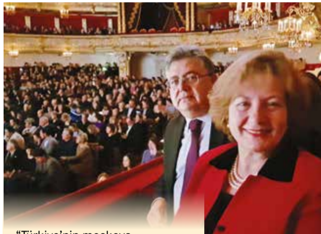
"Türkiye'nin Moskova Büyükelçisi Hüseyin Diriöz ve eşi Sibel Diriöz de Karahan'ın performansını izledi"

Benim için en büyük adres Bolşoy Tiyatrosu. Zira dünyanın en önemli ve en eski tiyatrolarından bir tanesi. Çok parlak bir geçmişi var ve halihazırda