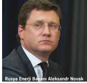
Rusya Enerji Bakanı Aleksandr Novak

ödemelerdeki payının azaltılması gerektiğini söylediğini hatırlatarak, "Ruble cinsinden ödemelerin genişleme eğilimi çeşitli alanlarda kendini gösteriyor" dedi.