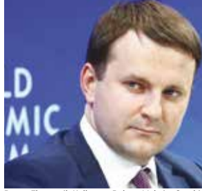
Rusya Ekonomik Kalkınma Bakanı Maksim Oreşkin

Peskov, Putin'in rubleyi dış partnerlerle ödemelerde kullanma pratiğinin genişletilmesi ve doların uluslararası