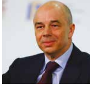
Rusya Maliye Bakanı Anton Siluanov