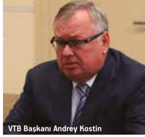
VTB Başkanı Andrey Kostin