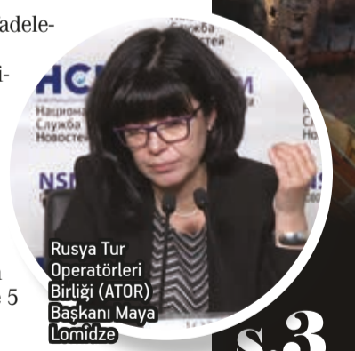
Rusya Tur Operatörleri Birliği (ATOR) Başkanı Maya Lomidze

Rus turistlerin Türkiye'de en çok rağbet ettiği turizm yerlerinden olan Antalya'ya 1 Ocak - 31 Ekim tarihlerinde 5 milyon 414 bin turist ziyaret etti.