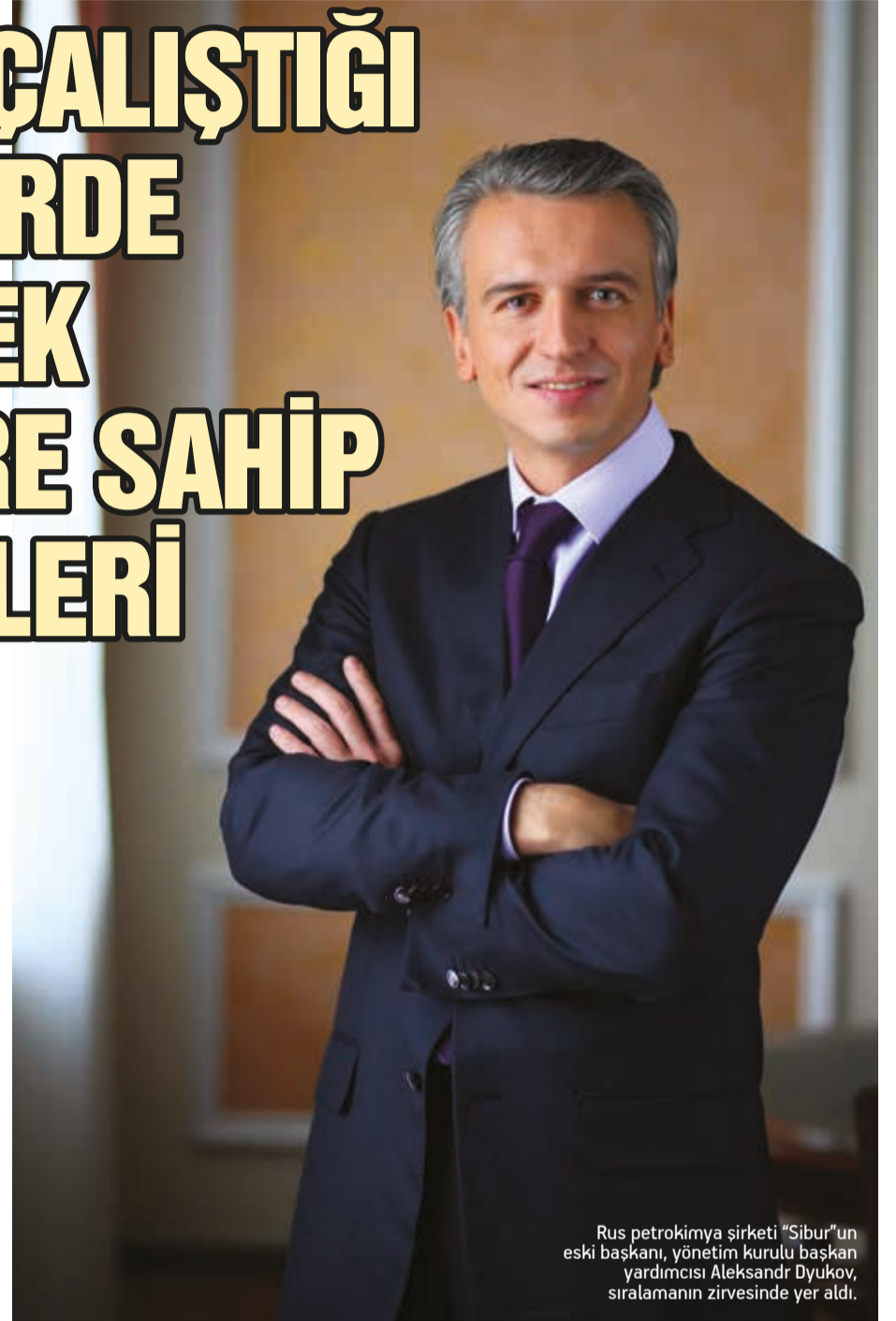
Rus petrokimya şirketi "Sibur"un eski başkanı, yönetim kurulu başkan yardımcısı Aleksandr Dyukov, sıralamanın zirvesinde yer aldı.

Bu sene listeye ilk kez Sberbank Başkanı German Gref 19'uncu sıradan (2 milyon 600 bin dolar) ve "Aeroflot" Genel Müdürü Vitaliy Savelyev 20'ci sıradan (2 milyon 200 bin dolar) dahil oldu.