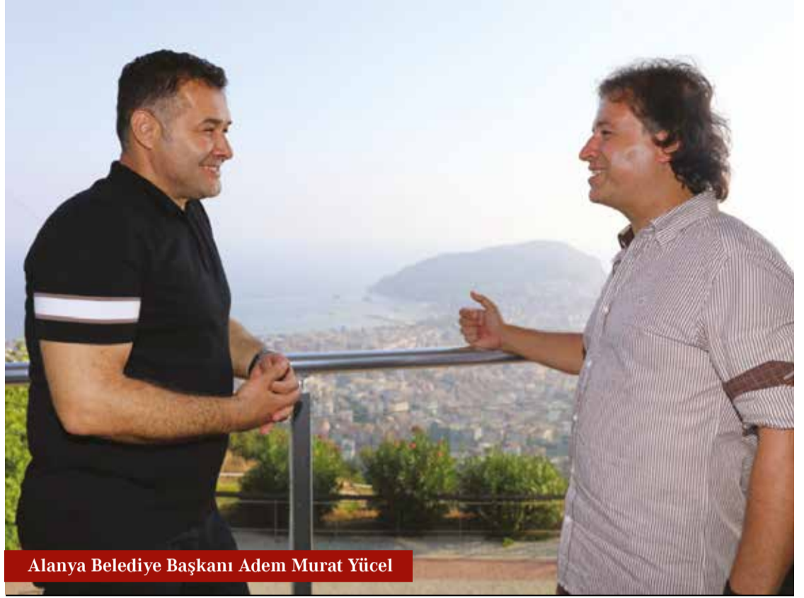
Alanya Belediye Başkanı Adem Murat Yücel

Alanya'da bine yakın yabancı sermayeli şirket var ve yüzde 80'ni Rus. Genellikle de inşaat ve emlak alanlarına sıkışmışlar. Rus iş insanlarına tavsiyem bölgemizde bunun dışındaki imkanları da görüp değerlendirmeleri. Gerekirse bize danışınlar biz onlara yol gösteririz.”